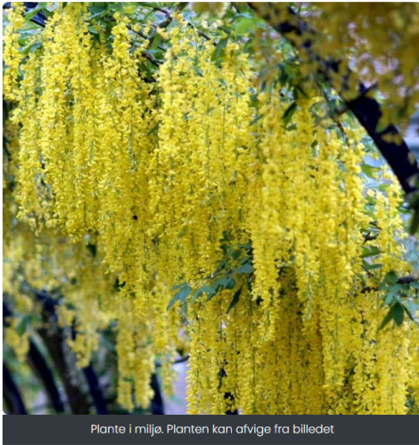
Plante i miljø. Planten kan afvige fra billedet

TIL FORSIDEN > PLANTER > TRÆER > ALLE TRÆER > TRÆER VELEGNET TIL ALLÉ > GULDREGN ALMINDELIG (LABURNUM ANAGYROIDES 'YELLOW ROCKET') – FLERE VARINTER